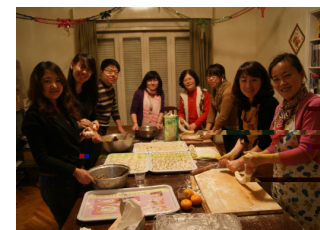
上图：驻日本使馆教育处举行中国留学生学友干部新年联欢会。