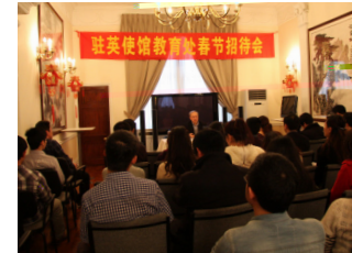
左图：2012 年驻英国使馆教育处举办新春招待会。

回调研报告 1200 余篇，编印国外教育调研材料汇编 16 期，其中 15 篇调研报告得到国家领导人重要批示。