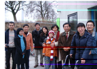
下图：驻加拿大使馆教育处教育公参春节看望加东 2 省我留学人员。